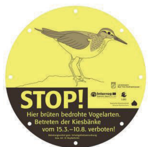
Fabian Unger informiert Bootfahrer*innen und Sonnenbader*innen an der Isar; Die Wiederansiedlung der Flusseeeschwalbe an der Pupplinger Au erweist sich als schwierig; Neue Beschilderung zum Schutz der Kiesbrüter