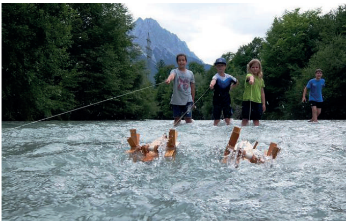
Kinder lernen spielerisch die Kraft der Ammer kennen.

Ein abwechslungsreiches, öffentliches Exkursionsprogramm ist der zweite Baustein des Projekts. Diese Ausflüge sind auf Familien