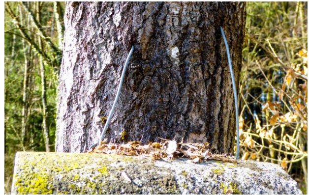
In die Borke eingewachsene Drähte, Nägel und Aufhängevorrichtungen.